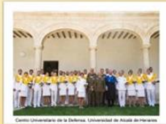
Centro Universitario de la Defensa. Universidad de Alcalá de Henares